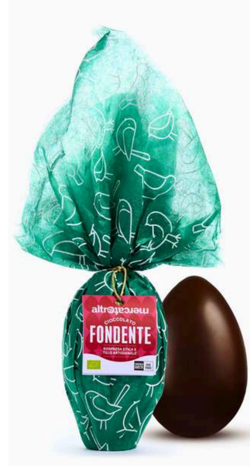
UOVO DI CIOCCOLATO FONDATE BIO, CON SORPRESA 200g (ALTROMERCATO)

DISPONIBILE IN ARANCIONE E VERDE BRILLANTE