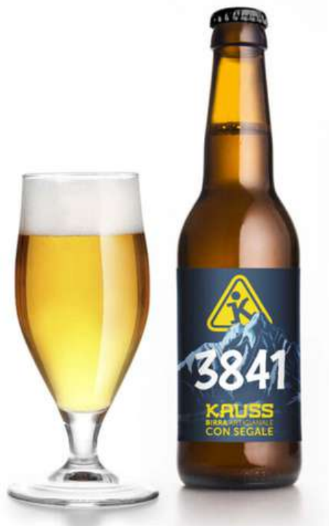
KAUSS 3841 BIRRA LAGER CON SEGALE ALPINA 33 cl 4.40€