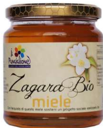
MIELE DI ZAGARA BIO

PRODUCE MIELI DOP, PAPPA REALE, CERA E PROPOLI DI ALTA QUALITÀ, ALCUNI DEI QUALI PREPARATI E CONFEZIONATI PRESSO IL LABORATORIO DI PIASCO (CN) DELLA NOSTRA COOPERATIVA “ IL RAMO ”.