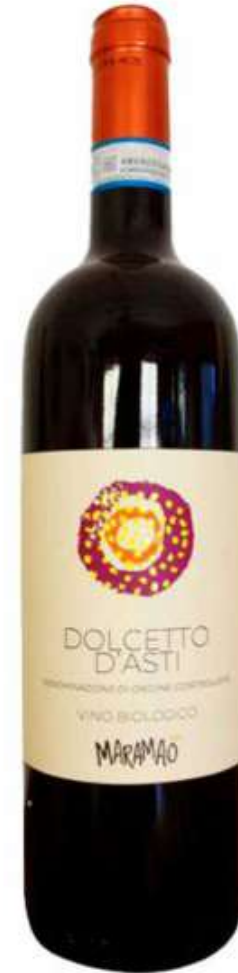
DOLCETTO D'ASTI 750 ml 8.50€