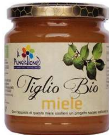
MIELE DI TIGLIO BIO