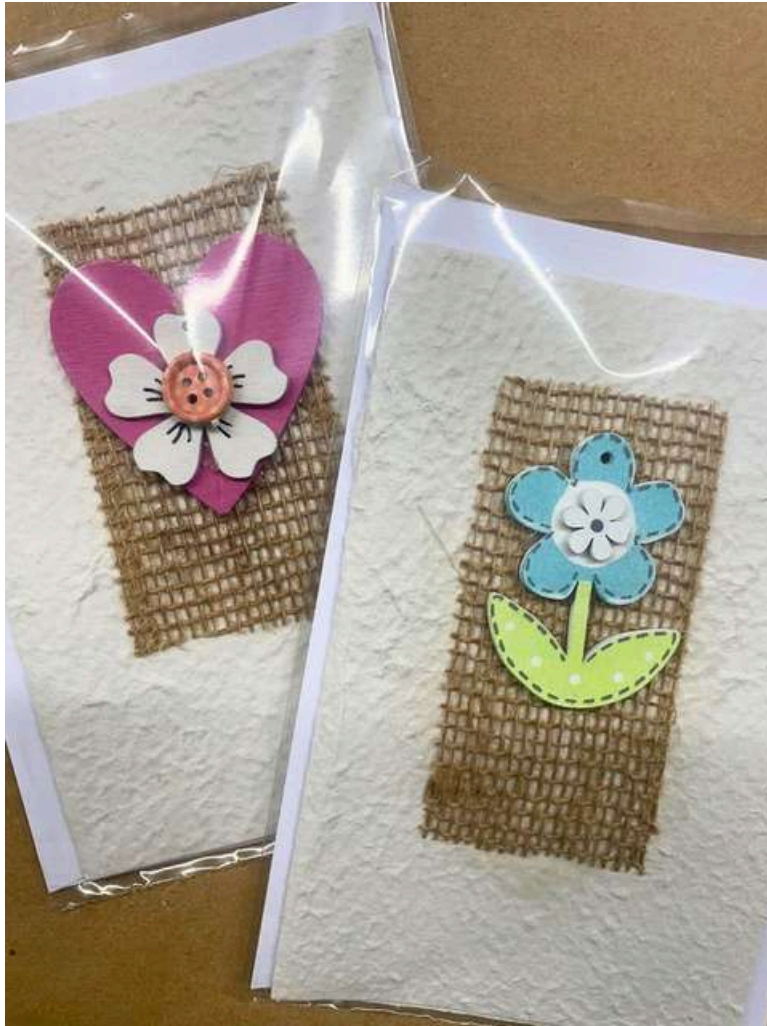
BIGLIETTI AUGURALI GRANDI 2,50€