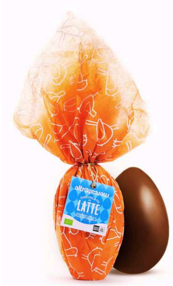
UOVO DI CIOCCOLATO AL LATTE BIO, CON SORPRESA 200g (ALTROMERCATO)

DISPONIBILE IN ARANCIONE E VERDE BRILLANTE