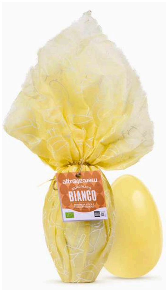
UOVO DI CIOCCOLATO BIANCO BIO, CON SORPRESA 200g (ALTROMERCATO)