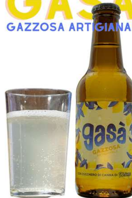
GASÀ GAZZOSA ARTIGIANALE 25 cl 2.50€

(ALTRI TIPI DI BIRRA DISPONIBILI SU ORDINAZIONE E IN BASE ALLA STAGIONALITÀ)