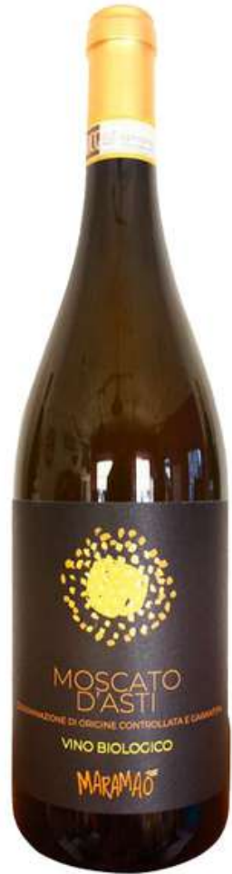
MOSCATO D'ASTI 750 ml 11.00€