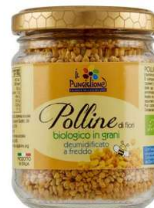
POLLINE BIO IN GRANI